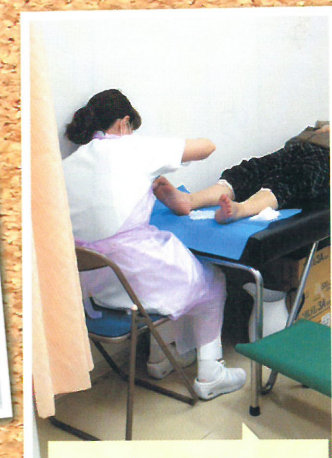
フットケア外来は 毎週火曜日 14時～ 行っています