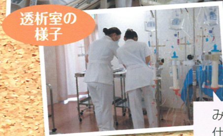
みんなで協力しあって 仕事をしています