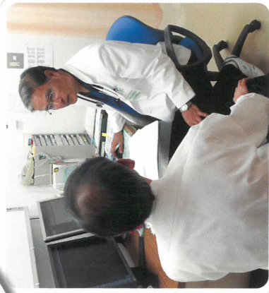
右が岡田センター長。