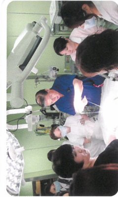
岡田センター長から、手技の説明を聞く看護師たち。