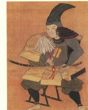
(半兵衛の肖像画。HPから)

官兵衛は、三木城攻めの最中、毛利方に寝返った伊丹の有岡城主・荒木村重を説得に行き、かえって囚われの身となって音信不通となりました。その時、信長から「毛利方に寝返った」と疑われて、その前年に信長に人質として差し出して秀吉の長浜城に留め置かれていた嫡男の松寿丸(10歳。後の黒田長政)は、信長の命令であわや殺されるどころでしたが、半兵衛が連れ出して自分の郷里の美濃に匿い、難を免れました。幽囚中の官兵衛はそのことを知らず、有岡城落城後、約1年ぶりに解放されてそれを知った時には、既に半兵衛は世を去っていました。(事務局 津田明彦)