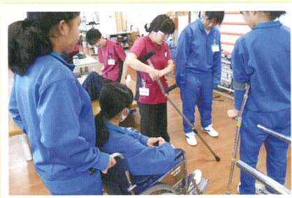
トライやるウィーク (中学生)

当院では、中学・高校生の体験学習や専門学校・大学生の実習を定期的を受け入れています。 (下の写真のほかに、看護学生、栄養科学生、理学療法科学生などの実習も受け入れています。)