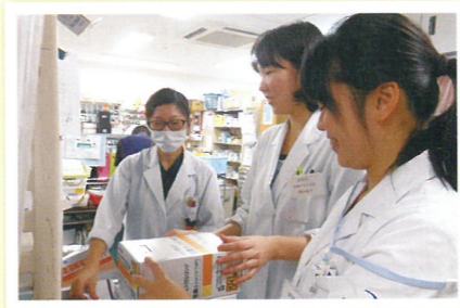
薬学部学生の実務実習 (大学生)