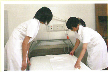
ふれあい看護体験 (高校生)