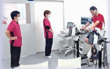
当院の職員に CPX の予行演習