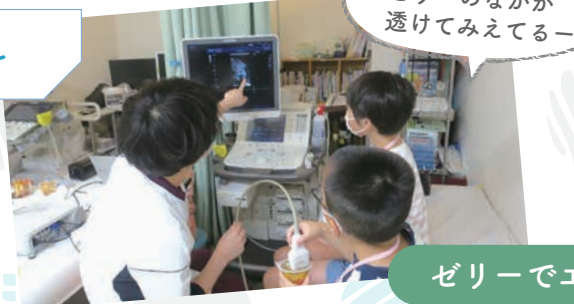
ゼリーでエコー体験