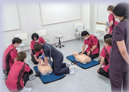
一次救命処置の研修