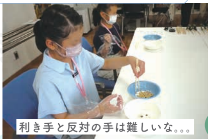
利き手と反対の手は難しいな。。。