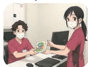
⑤ 問診 (Ns/PT)