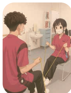
⑥ レジスタンストレーニング