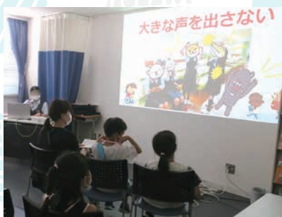
会議室で説明スライド