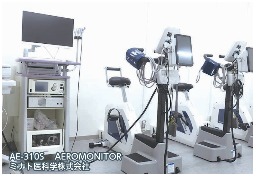
AE-310S AEROMONITOR ミナト医科学株式会社