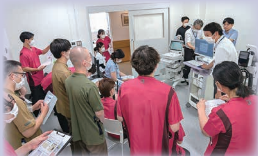
医療機器メーカーの方から操作説明会