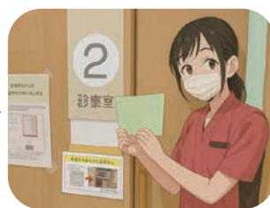
③ 診察 (医師)