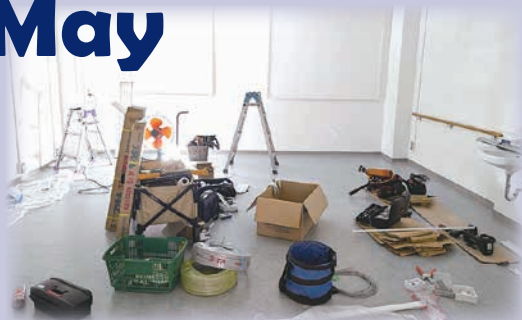
職員食堂を心リハ室に改修