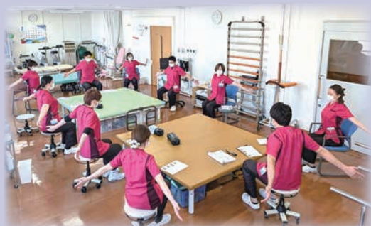
レジスタンストレーニングのプログラムを練習