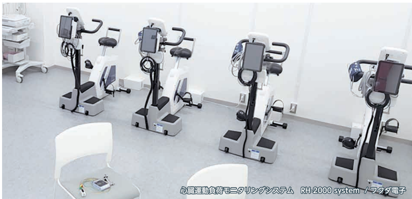
心臓運動負荷モニタリングシステム RH-2000 system / フクダ電子